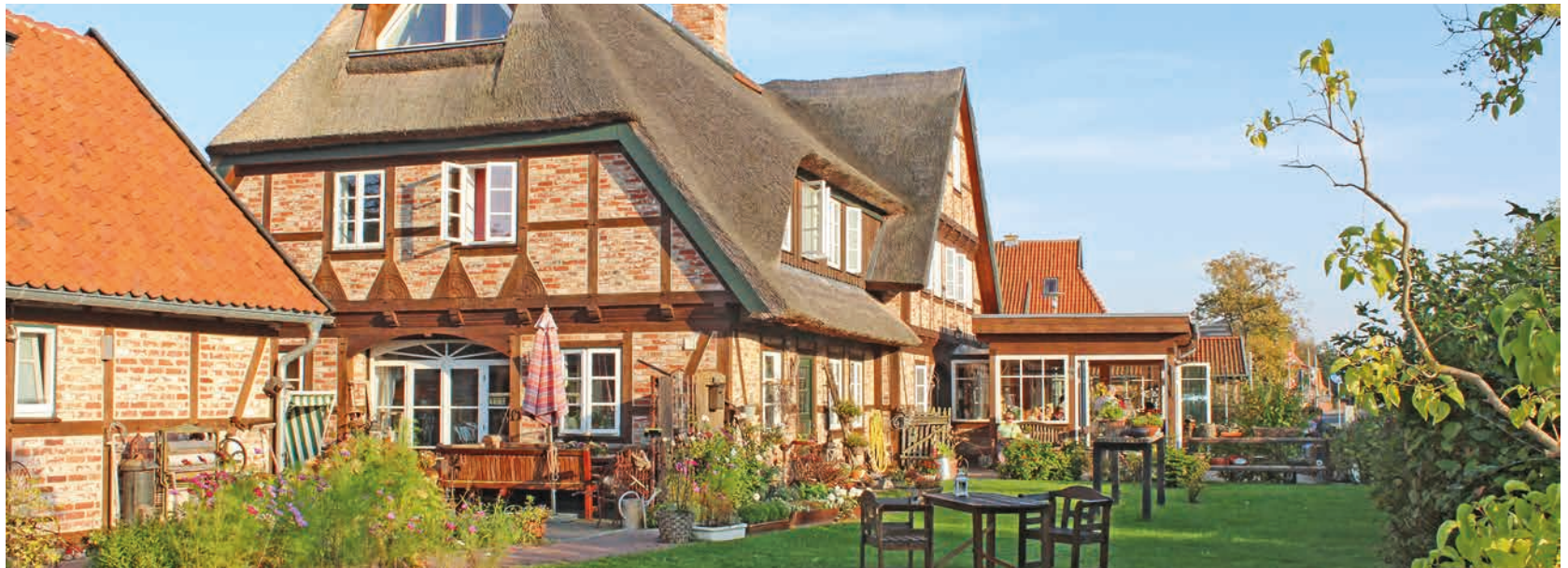
Fachwerkhäuser in Börgerende

Der Bäderstil ist streng genommen kein eigener Baustil, sondern kombiniert sehr frei klassische Formen und Jugendstilornamente. Oft hat man die Fassaden in einem vornehmen Weiß gehalten, wie zum Beispiel bei der Weißer Stadt in Heiligendamm (£ Seite 80). Im alten Ortskern von Warnemünde sieht man eine Art Vorform: Hier wurden alten Fischerkaten und Bauernhäusern einfache Holz-Glasveranden vorgebaut (£ Seite 34).