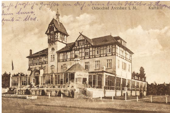
1905 eröffnete das Kurhaus Kühlungsborn, heute steht hier das „Haus Meeresblick“

Bodenreform in der Sowjetischen Besatzungszone: Großgrundbesitzer mit mehr als 100 Hektar Fläche werden enteignet. Bildung des Landes Mecklenburg-Vorpommern.