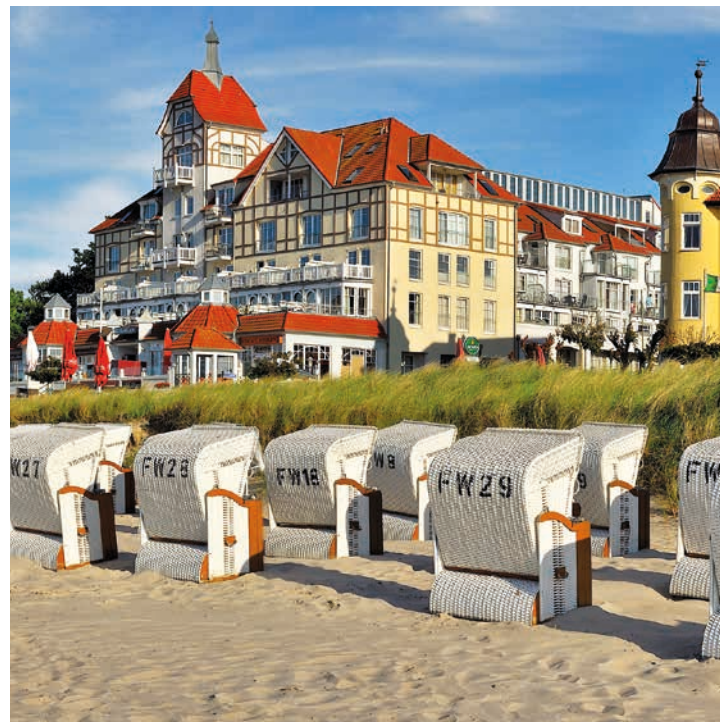
Strand und Promenade in Kühlungsborn West

Verwaltung: Das Kühlungsborner Land liegt in Mecklenburg, dem westlichen Teil des Bundeslandes Mecklenburg-Vorpommern. Warnemünde ist ein Vorort von Rostock, alle anderen Orte gehören zum Landkreis Rostock.