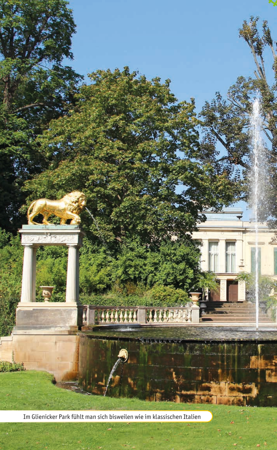
Im Glienicker Park fühlt man sich bisweilen wie im klassischen Italien