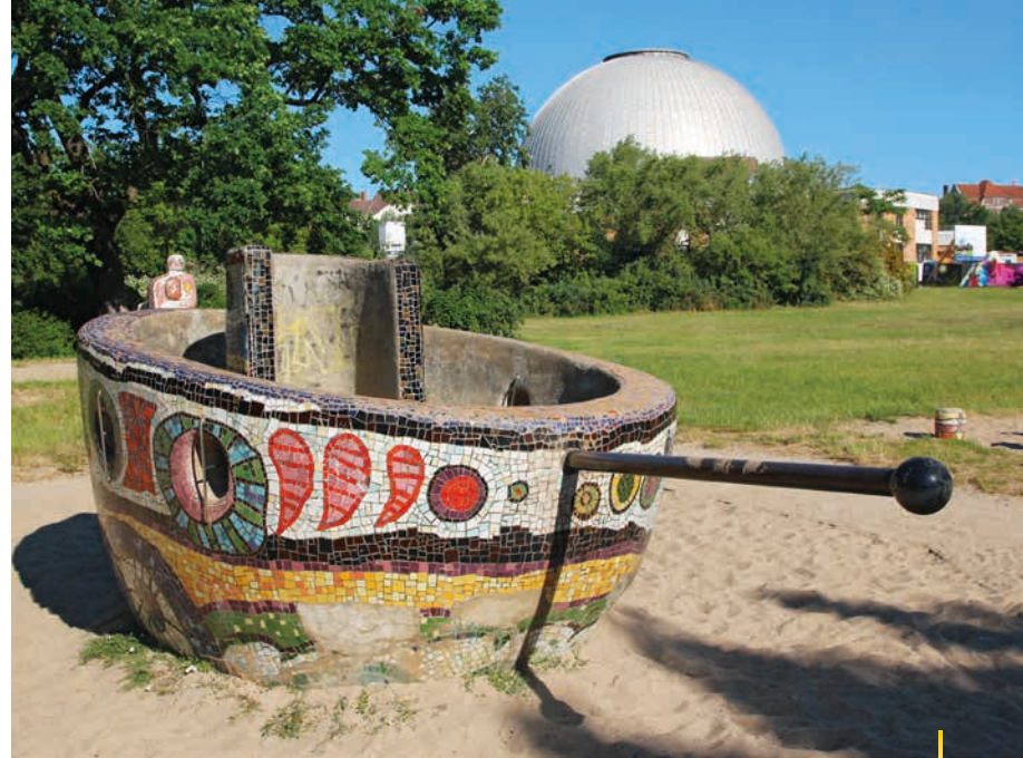
Am Sternenspielplatz macht das Sandkuchenbacken Spaß