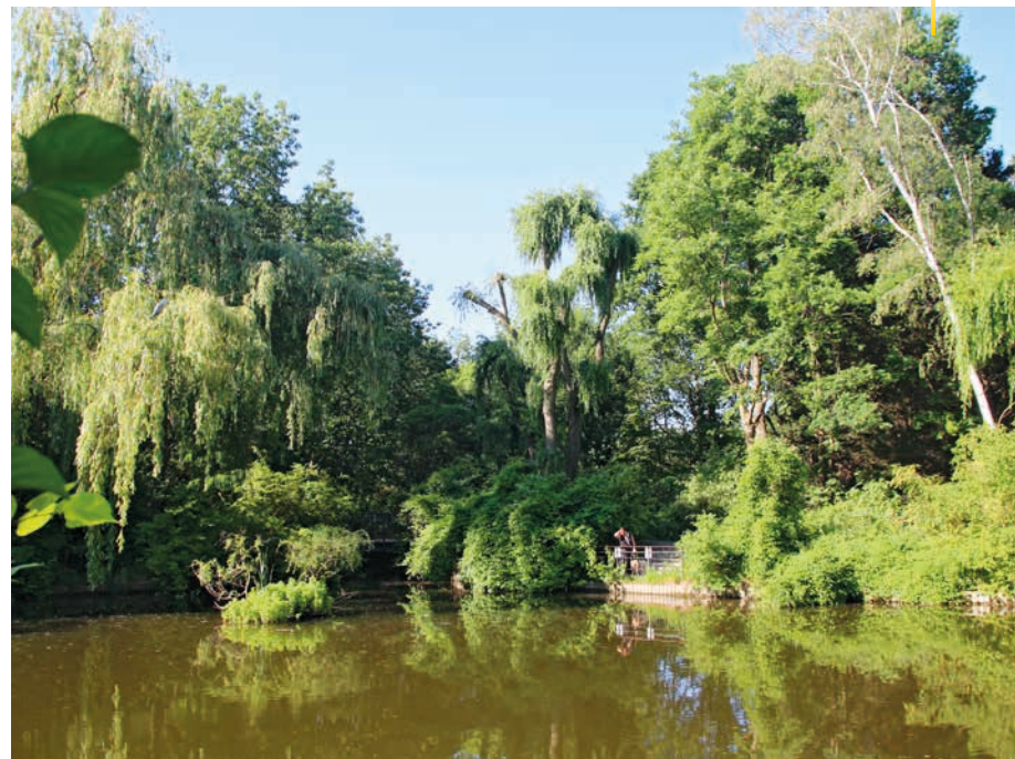
Der Teich im Ernst-Thälmann-Park ist von dichtem Grün umgeben