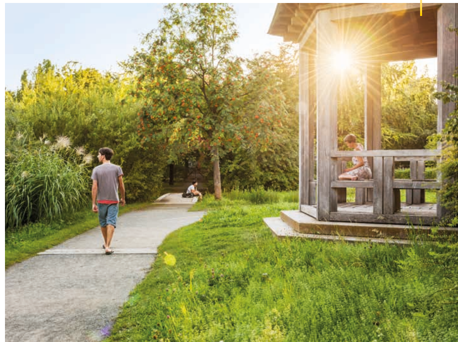
Das Seelenparadies im Comenius-Garten lädt zur Reflexion ein