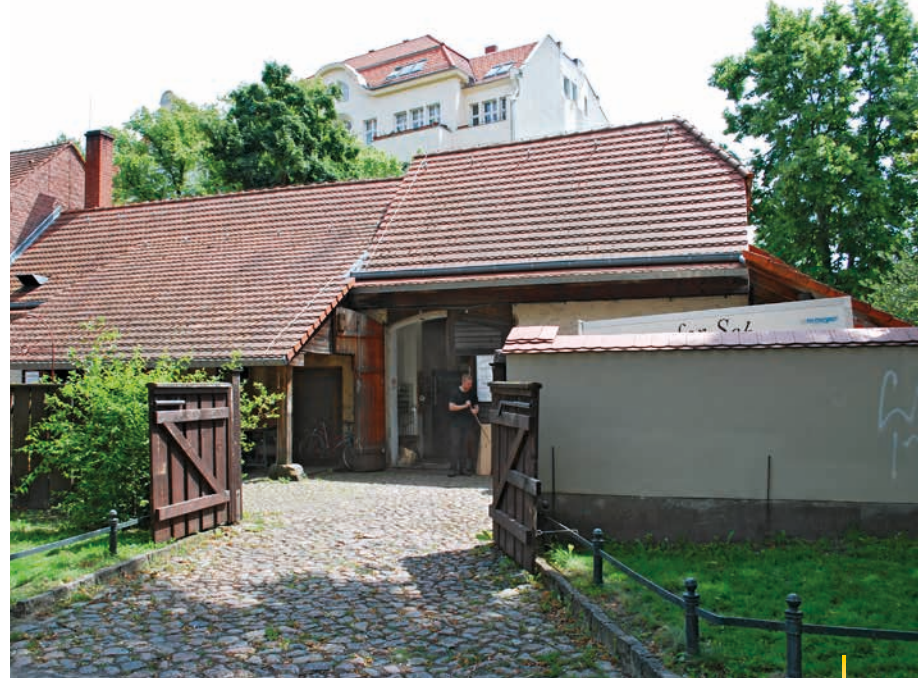
Die Schmiede in Alt-Rixdorf ist bis heute in Betrieb

Von deren Wirken zeugt auch der wundervolle Comenius-Garten in der Richardstraße 35, eine öffentlich zugängliche Gartenanlage. Der Garten wurde zwar erst 1992 angelegt, basiert aber auf den überlieferten Vorstellungen des böhmi-